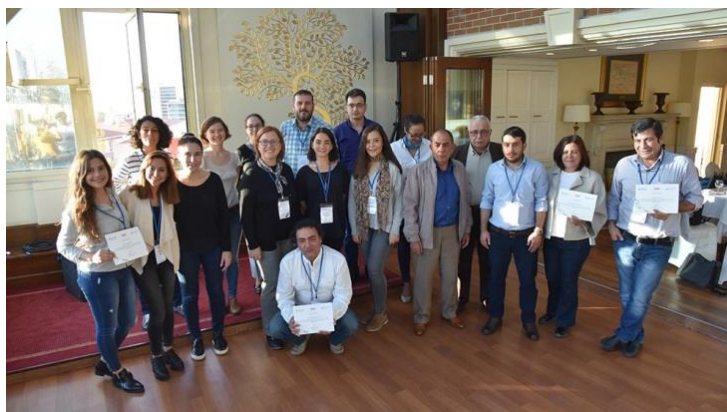
La Fondation du Tiers Secteur de la Turquie (TUSEV) - un des 3 coordinateurs du